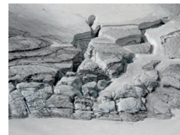
Spaltenzone im oberen Läntagletscher