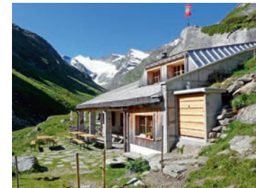
Länthütte SAC mit Rheinwaldhorn