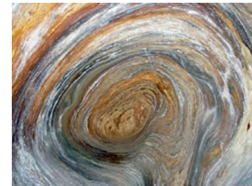
Gletschermühle zwischen Vals und Zervreila