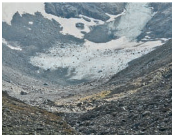
Zunge des Läntagletschers, Herbst 2013

Tipp: Wer Zeit hat, setzt sich am Gletscherrand auf einen Felsblock und lauscht den Geräuschen der Gletscherwelt. Oft führt einem die Thermik kühlen Eiswind an die Haut. Und die hoch ansteigenden Bergflanken rundherum lassen uns in dieser Welt plötzlich ganz klein erscheinen. Die vom Gletscher zermahlene Steine finden sich als feiner Sand entlang der Wasserläufe. Und wer mit etwas Glück an Steinen grüne, glasartige Nadeln oder weinrote Warzen entdeckt, hält die Mineralien Turmalin oder Granat in seinen Händen.