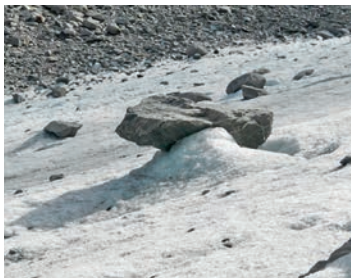
Gletschertisch auf dem Läntagletscher