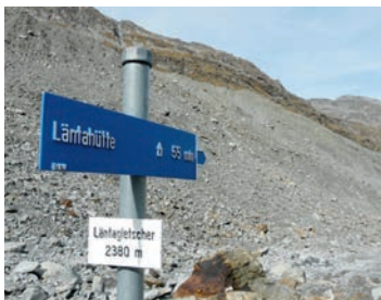
Hohe Seitenmoränen prägen das Vorfeld von Läntha- und Grauhornletscher.

Auch wenn das nahe Eis lockt und der zerspaltene Gletscher gegen das Rheinwaldhorn hoch das Interesse auf sich zieht, im Gletschervorfeld und das Tal auswärts liegt der eigentliche Formenschatz, der vom Eis gestaltet wurde. Denn Gletscher sind im eigentlichen Sinne Landschaftsmodellierer. Ihr stetes Kommen und Verschwinden über die Jahrtausende hat die Bergwelt mehrfach überformt und umgestaltet. Wie die Gletscher, einem Schleifpapier gleich, Felsen ritzen, abschleifen und polieren, ist im ganzen Länatal eindrücklich zu sehen. So sind die mächtigen Felswände, entlang der nördlichen Seite vom Zervreilasee bis hoch zur Lampertschalp, das Hobelwerk des eiszeitlichen Läntagletschers. Das ganze Länatal präsentiert sich als oval geformter Gletschertrog, mit seitlichen Nischen und hochgelegenen Karen, die einst alle vom Eis ausgefüllt und modelliert wurden. Im Ochsenstafel ducken sich die beiden Holzhütten an die Leeseite eines glatt polierten Rundhöckers. Gut sichtbare Schrammen, in Fließrichtung des Eises in den Fels gekerbt, findet man nicht nur dort, sondern auch an grossen Felsblöcken, die unmittelbar vor der Gletscherzunge aus dem Moränenschutt ragen.