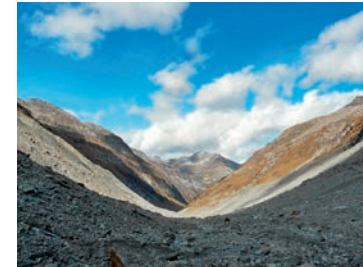
Das Länatal als modellhafter Gletschertrog