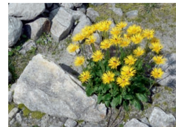
Erste Vegetation: Der Gletscherpetersbart